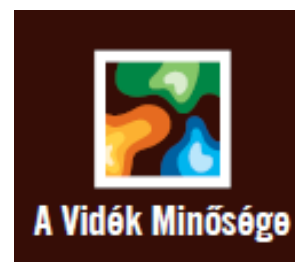
Az európai területi A Vidék Minősége védjegy

Az európai területi „ A vidék minősége ” védjegyet azok a vállalkozások, intézmények, szervezetek használhatják, melyek az Alpokalja-Fertő táj Egyesület illetékességi területén találhatóak/működnek, tagjai, vagy hálózati tagjai az Alpokalja-Fertő táj Vidékfejlesztési Egyesületnek és rendelkeznek a térségi szintű, a vidék minőségét szimbolizáló „Alpokalja-Fertő táj” védjeggyel. Az európai területi védjegy használata a térségi vállalkozások, intézmények, szervezetek számára többletkötelezettséggel nem jár. Az Alpokalja-Fertő táj Egyesület, illetve a térségi védjegy mindenkor tulajdonosának felelőssége annak biztosítása, hogy a kialakított területi védjegy kialakításának módszere és feltételei megfeleljenek az európai területi védjegy alkalmazására.